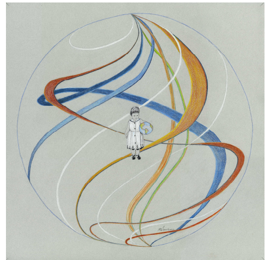
L'envol de la terre Anne-Marie Bourbeau Image numérique 20'' x 20''

Cette exposition démontre la vitalité de l'atelier Les Moraines dans la continuité. Il permet aux graveurs professionnels et amateurs de partager un espace d'échange et de travail qui encourage la créativité. Fidèle collaborateur de la programmation du Carrefour culturel, le collectif présente L'Envolée, une exposition qui regroupe les œuvres de cinq artistes. Bien que les démarches des artistes soient différentes, l'exposition présente un ensemble cohérent, orientée vers des envolées lumineuses. À travers le mouvement des lignes, des plans, des couleurs, les artistes invitent le spectateur à pénétrer dans un univers riche en sentiments faisant appel à l'intelligence.